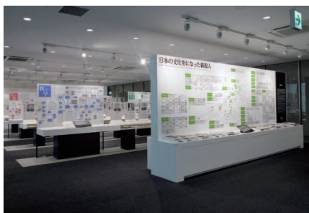
▲▶ テーマや分野ごとの展示コーナーに、20V型タッチディスプレイを合計7台(各コーナーに1台)設置。