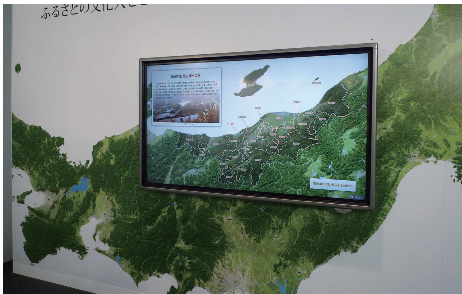
壁一面に貼られた日本地図の新潟県の部分は、70V型のタッチディスプレイ「BIG PAD」で表示。市町村名をタッチすることで、市町村別に文化人を検索できるようになっている。