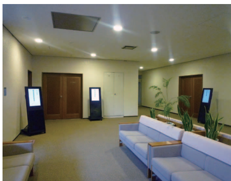
全 9 台の端末表示を一元管理。

また、施設予約システムから出力される CSV ファイルを直接利用することが可能なほか、端末の再生モニタリングやスケジュールに沿って自動で行われる電源の ON/OFF など、シンプルで簡単な運用方法は、煩雑だった管理業務を効率化している。